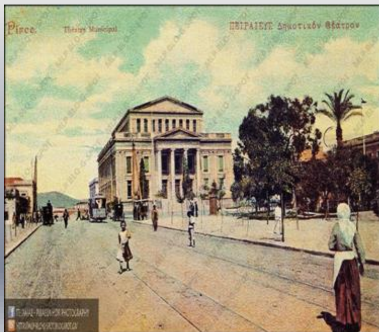
Δημοτικό Θέατρο Πειραιά σε επιχρωματισμένο δελτάριο - Αρχές 20ου αιώνα